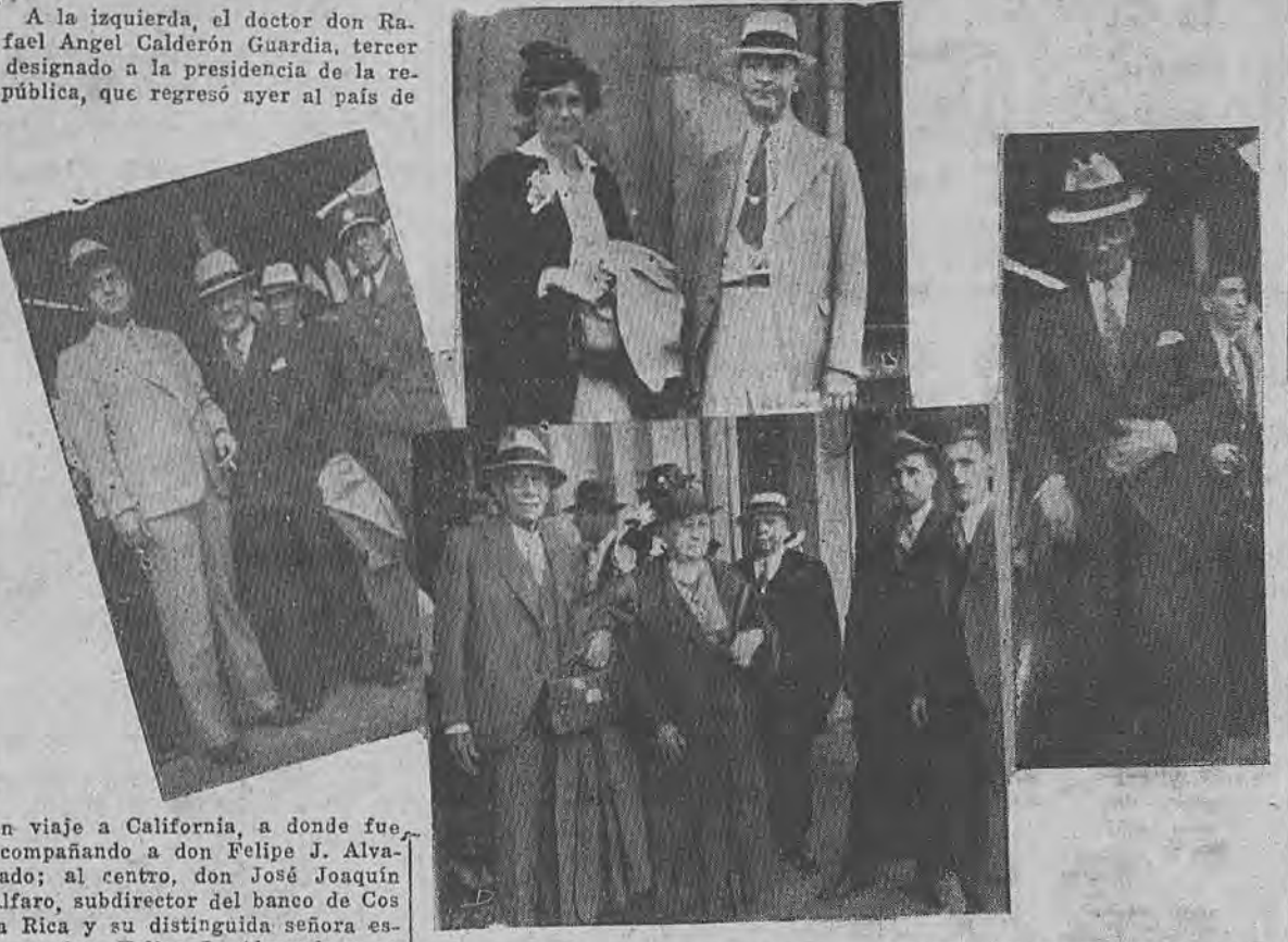
A la izquierda, el doctor don Rafael Ángel Calderón Guardia, tercer designado a la presidencia de la república, que regresó ayer al país de un viaje a California, a donde fue...