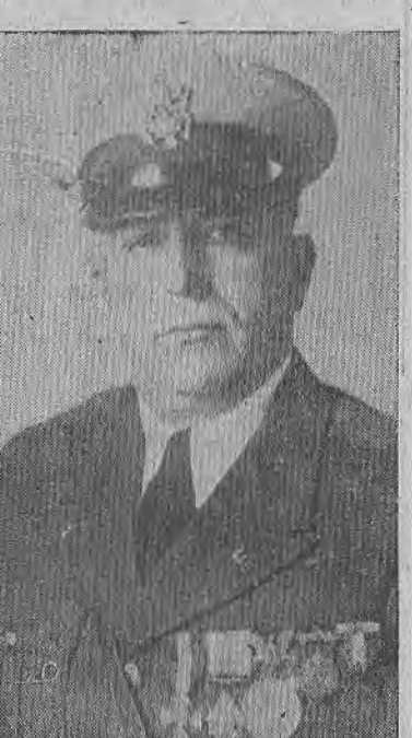
(VEA Col. 1.—Pág. SIETE)

LIMON, 5.—(Especial para DIARIO DE COSTA RICA).—Un personaje muy importante de la policía secreta de los Estados Unidos, ha sido huésped por espacio de pocas horas de las autoridades de este puerto. Nos referimos al capitán Michael Flascchetti, quien, viajó en vía de recreo en el vapor Petén.