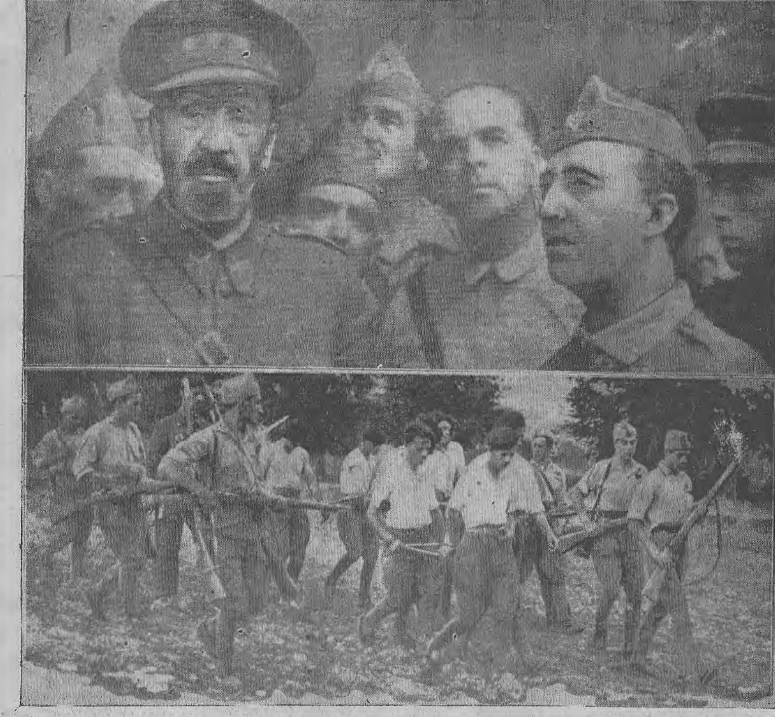
ARRIBA: Primera fotografía del dramático rescate de los defensores del Alcázar de Toledo. A la izquierda, lleno de barba, el Coronel José Moscardó, defensor de la fortaleza en el estado en que lo encontró el General Francisco Franco, quien aparece en el extremo derecho. ABAJO: Apuntados por los rifles de los rebeldes, marchan estos leales que fueron hechos prisioneros en el frente Bilbao-San Sebastián.